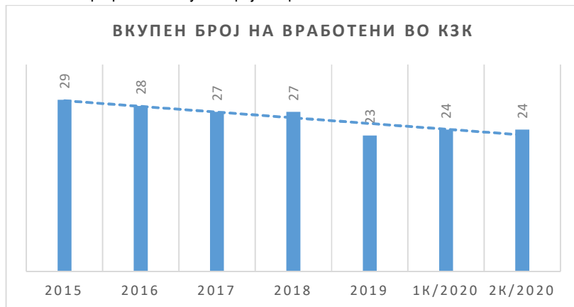
Графикон 1: Вкупен број на вработени во КЗК 2015-2К/2020