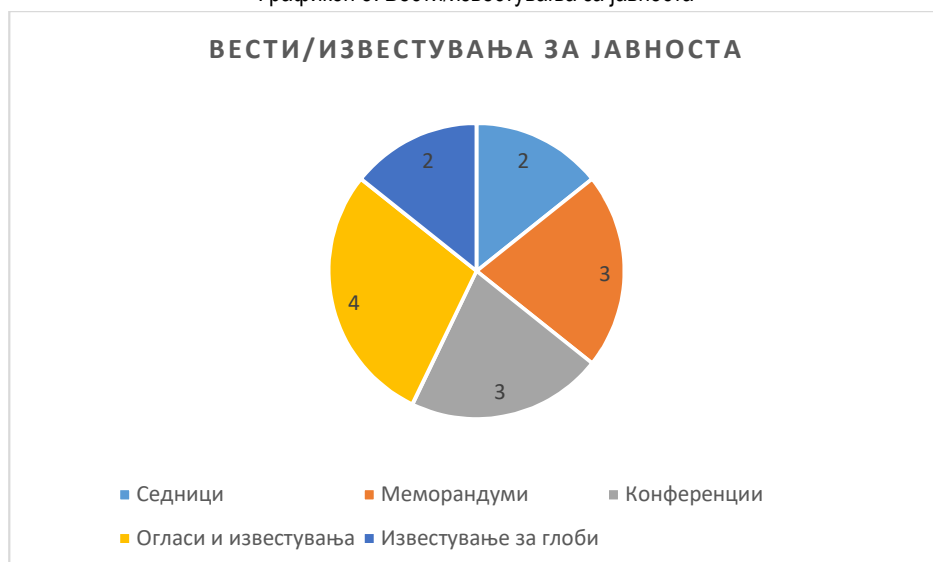
Графикон 5: Вести/известувања за јавноста

За 2019 година КЗК има објавено вкупно 14 вести/известувања за јавноста, додека за претходните години ниедна вест. При тоа, вестите/известувања се однесуваат на склучени меморандуми, седници, конференции и слично. Дополнително, вестите не се објавуваат ажурно, во моментот на случувањата, или непосредно по завршувањето на настаните за кои се објавува веста туку со доцнење од 2 недели до 9 месеци. Во првото полугодие од 2020 година, Комисијата нема објавена ниедна вест или новост освен едно известување за склучен меморандум помеѓу Комисијата и Народната Банка во првиот квартал. Оттука, оценуваме дека е потребна засилена комуникација со јавноста во насока на нејзино навремено и редовно информирање.