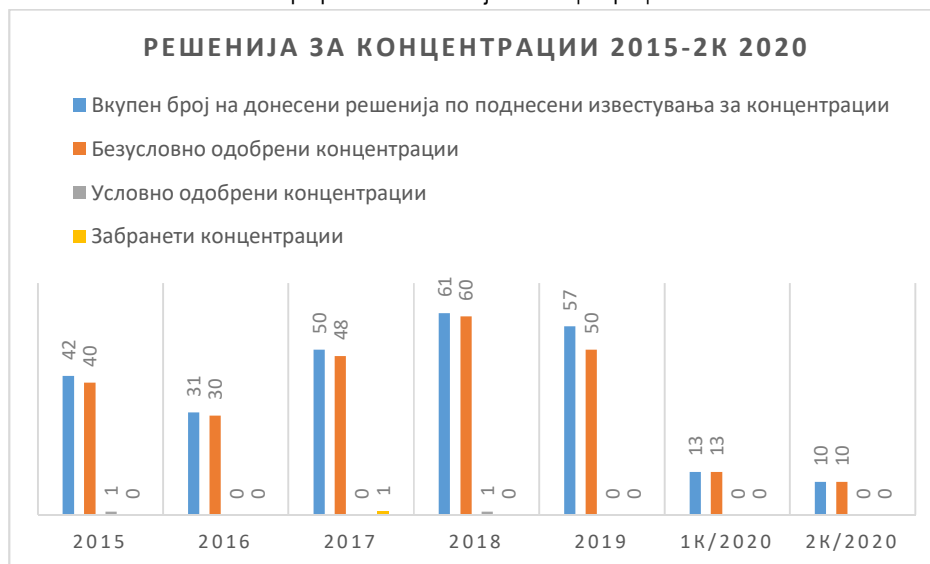
Графикон 3: Решенија за концентрации