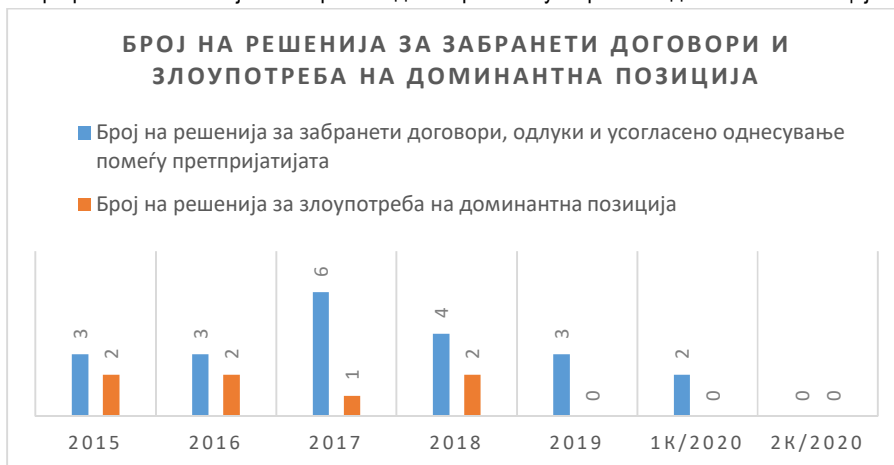
Графикон 2: Решенија за забранети договори и злоупотреба на доминантна позиција