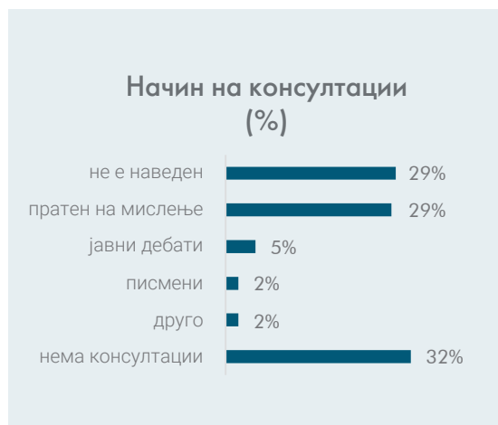
Grafiku 1: Mënyra të konsultimeve

Në VNRR raportet, ministrinë janë të obliguara ta publikojnë mënyrën në të cilën i kanë zbatuar konsultimet. Prapëseprapë, ky obligim jo gjithmonë respektohet në tërësi. Në raport me mënyrat e konsultimit në gjithsej 136 raste të cilat ishin objekt i analizës, në 44 (32%) prej tyre nuk ka pasur konsultime, ndërsa në 39 (28%) të rasteve propozimi është i dërguar për mendim në organet kompetente shtetërore. Debate publike janë organizuar në 7 raste, konsultime me shkrim në 3 raste, gjithashtu si edhe për “lloje të ndryshme të konsultimeve” ku më shpesh nënkuptohen grupet e punës. Në 40 raste e tjera (29%), nuk është theksuar për atë se çfarë lloj konsultime janë mbajtur.