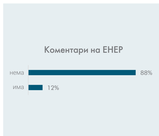
Grafiku 4: Komente të ENER

Komentimi paraqet një nga funksionet kyç të ENER me atë që komentimi është instanca e fundit për të gjitha palët e involvuara të komentojnë për një propozim të caktuar, ndërsa gjithashtu paraqet edhe mjet më i qasshëm për qytetarët. Prapëseparë, edhe përkundër këtij funksioni dhe mundësie që e ofron, ky mjet më shpesh nuk shfrytëzohet në mënyrë përkatëse. Kështu në 88% të dispozitave të cilat janë shqyrtuar nuk ka komente të dorëzuara nga palët e prekura..