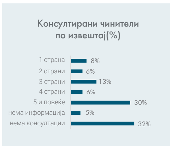
Grafiku 2: faktorë të konsultuar në sajë të raportit

Nga 92 të rasteve ku janë mbajtur konsultime, në 41 (44%) rast janë konsultuar pesë ose më tepër palë, nëntë herë janë konsultuar katër palë, 18 herë (20%) tre palë, tetë herë dy palë dhe 11 herë (12%) ka qenë e konsultuar vetëm një palë. Në pesë nga rastet nuk është theksuar numri i palëve të konsultuara. Me rëndësi është të theksohet se numri i palëve të konsultuara nuk është parakusht për cilësi dhe jo gjithmonë korrespondon me thellësinë e konsultimeve të realizuara. Prapëseparë, ministritë duhet të jenë të orientuara drejt diversifikimit të palëve si nga aspekti i relevancës së tyre, ashtu edhe nga aspekti i asaj se sa zgjidhjet e mundshme ndikojnë mbi to në mënyrë të drejtpërdrejtë.