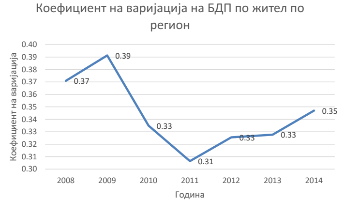
Графикон 2: Коефициент на варијација на БДП по жител по регион за периодот 2008-2014 година

Извор: Пресметка на авторот со податоци од Државен Завод за Статистика