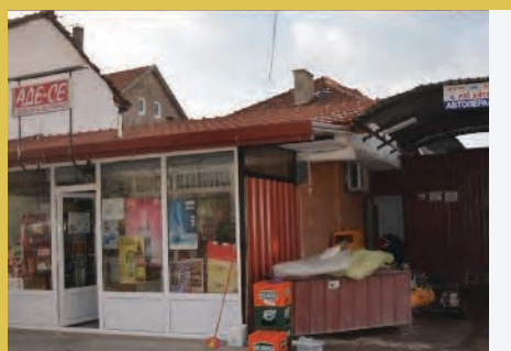
2. Зумбул Беќирова трговец, Аде-Се, Делчево