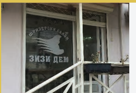
3. Зера Имбраимова Стојмановска занаетчија, Зизи Дем, Куманово